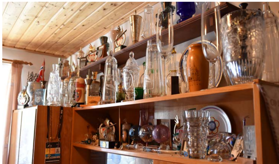
Sbírka trofejí (nenechte se zmást, je to jen část)

Až do roku 1956, kdy mi bylo deset. Pak nastal velký zlom na závodech v Harrachově. Děti tam měly jedny lyže na skok a jedny na běhání, to jsem žasnul. Já měl jedny a jen jsem si přehodil vázání. To první mistrovství jsem vyhrál a dostal své první skokanské lyže. V roce 1963 přišly moje první závody v zahraničí, ve Francii. Ty jsem také vyhrál a dostal se tím do juniorské reprezentace. Na mistrovství republiky ve Vysoké nad Jizerou jsem skončil třetí, a to už jsem věděl, že se budu skákání věnovat.