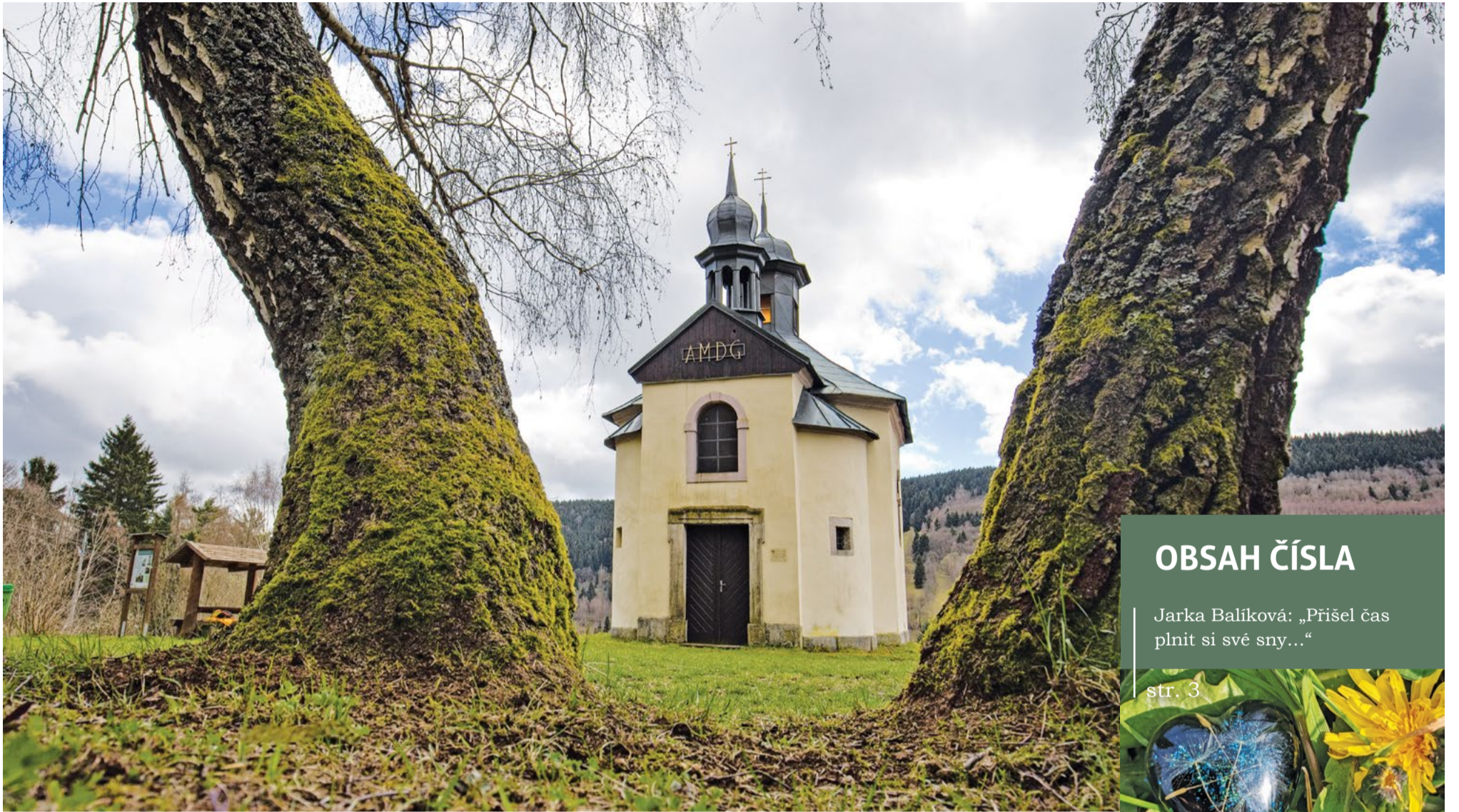
Foto: Svatojánská kaple v Jáchymově