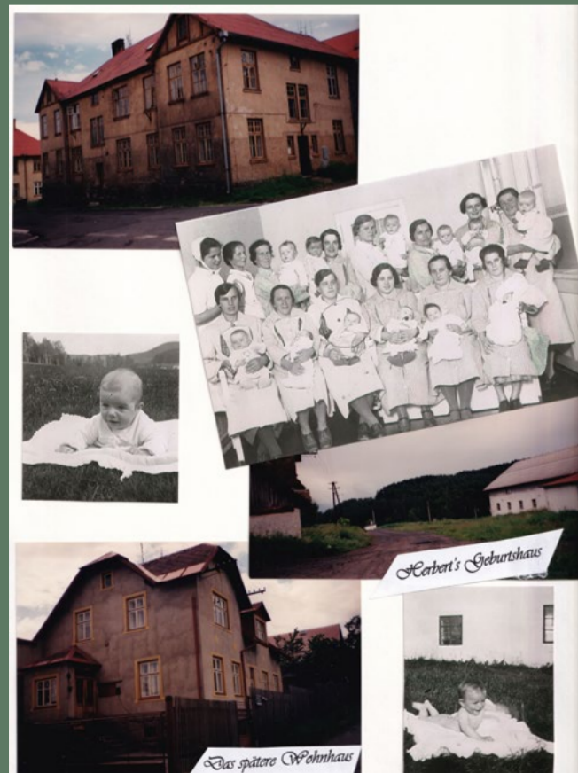
fotografie staré vlasti